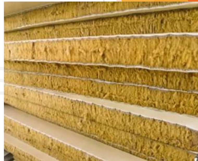
Isolation Laine de roche